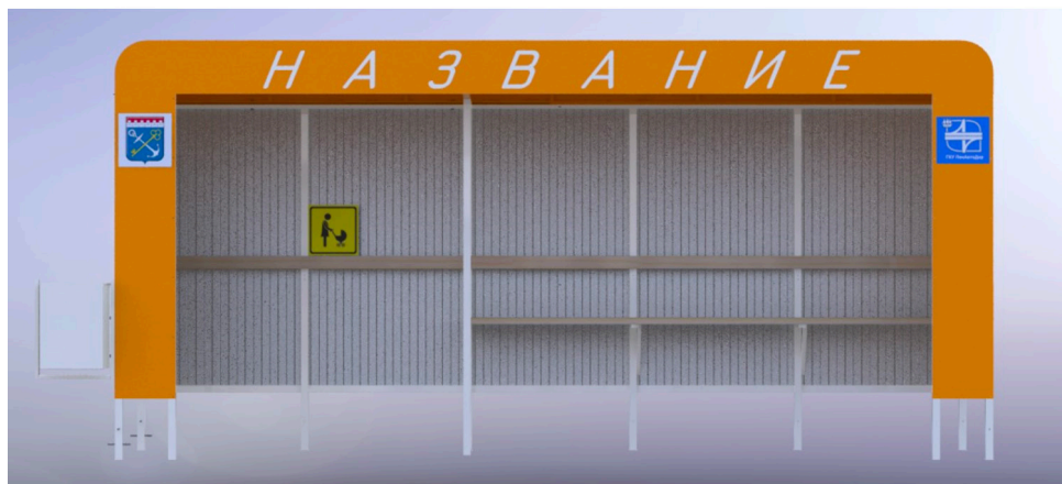
Рис. 1 Внешний вид павильона